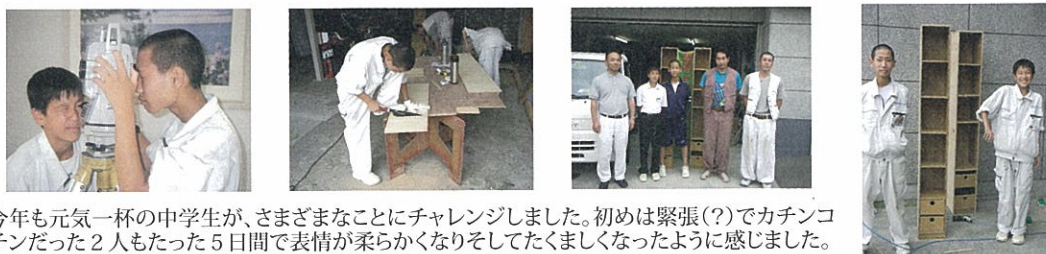
今年も元気一杯の中学生が、さまざまなことにチャレンジしました。初めは緊張(?)でカチンカチンだった2人もたった5日間で表情が柔らかくなりそしてたくましくなったように感じました。

トライやるウィーク(兵庫県が1998年から実施) 中学2年生を対象に実施している制度です。中学生が普段学校ではできないことを1週間学校を離れて挑戦する職場体験です。地域の人々とのふれあいを通じ生徒の心を育てたいという思いで実施されています。