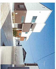
尼崎市南武庫之荘