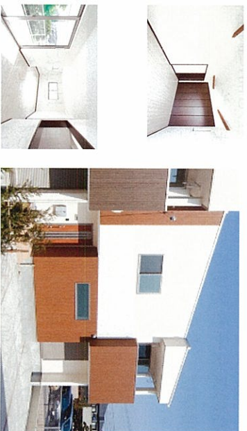
イーストコート 平成23年2月竣工

3月11日に発生しました東北地方太平洋沖地震で犠牲になられた方々のご冥福をお祈り致します。また、甚大な被害に遭われ不自由な生活を強いられている方々からお見舞い申し上げます。