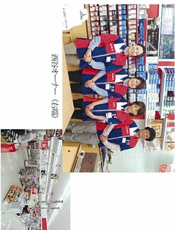
西谷オーナー (左端)