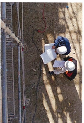
ISOサーベイランス風景

サーベイランスとはISO9001を認証取得した後、それらのシステムが確実に維持管理されているかどうか定期的に審査を受けることです。つまり会社の続く限り、永久的に継続のための審査を受けなければなりません。審査は経営者の責任に始まり工事現場の審査まで一日かけて行われました。その結果、観察事項はあったものの不適合はないとの結果を得て一安心です。これからもISO9001を有効的に活用して、業務の効率化や改善を行い、お客様により満足していただけるように努めてまいります。