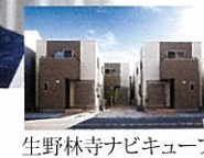
生野林寺ナビキューブ

当初は6階建てマンションの計画でしたが建設費の高騰、投資効率の低さ、駅付近にマンションが多いなどにより断念。その直後に友人からナビックの戸建賃貸住宅ナビキューブを紹介されました。構造、デザイン、投資効率、持家感覚で借りて頂けるなどの魅力が大きく、すぐに決心しました。知人の大工さんは「しっかりした建物であるにも関わらず建設費は安い!」と。誠実な現場監督のもと近隣にない借家が完成して大満足です!