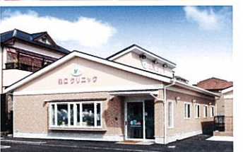
西宮市段上町6-17-30 TEL:0798-57-3792 HP: http://moriguchi-clinic.deca.jp/