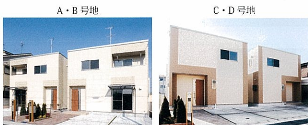
平成22年2月 尼崎市大庄 ナビキューブ