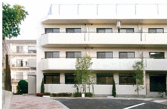
平成22年3月 西宮市老松町 ユーミーマンション