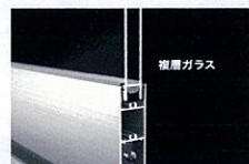
空気層により熱の伝導率を下げ、結露がしにくくなる複層ガラス