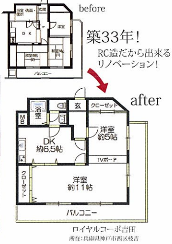
ロイヤルコーポ吉田 所在:兵庫県神戸市西区吉田