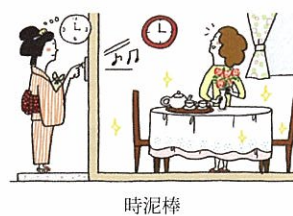
朝日マリオネット参照