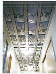
天井に敷き詰めた状態