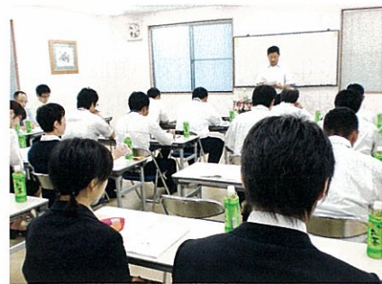
経営指針発表会風景